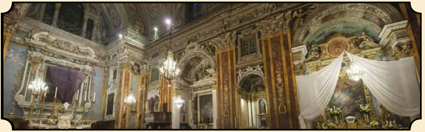
Église paroissiale Saint-Jacques-le-Majeur dite du Gesù