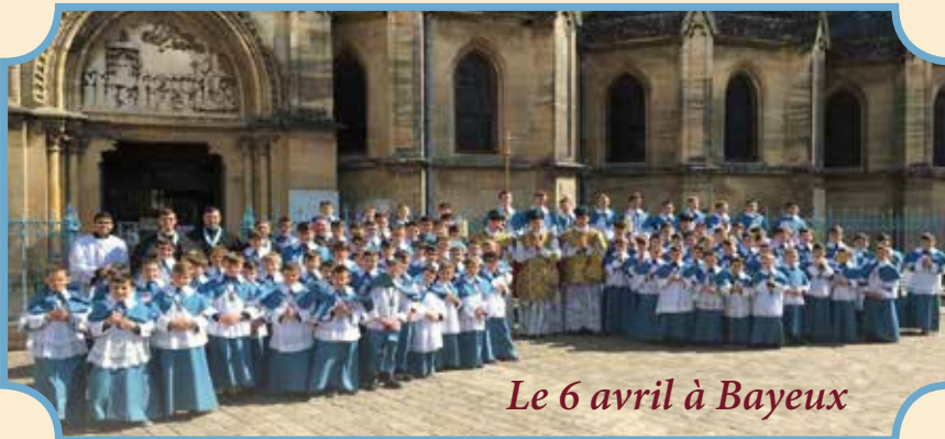
Le 6 avril à Bayeux

L E 30 mars dernier, Notre-Dame de Rocamadour a accueilli 70 soutanelles bleues venues des apostolats du sud de la France. Le 6 avril, ce sont plus d'une centaine d'enfants qui ont rempli le chœur de la basilique de Douvres-la-Délivrande près de Bayeux. Des occasions de découvrir les richesses religieuses de notre pays mais aussi de renforcer les liens entre les différents membres de la grande famille de l'Institut.