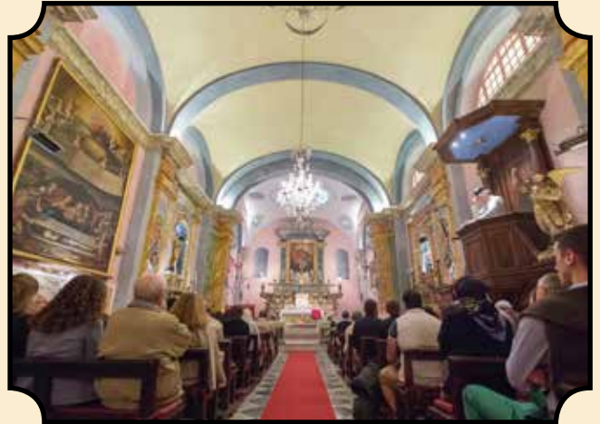
Messe dans la chapelle des Pénitents rouges

LE matin, les rues du Vieux-Nice sont encore fraîches, emplies de la discrète rumeur de tous ceux qui laborieusement préparent leurs commerces pour l'arrivée plus tardive et tapageuse des touristes qui envahiront les rues en approchant midi. Tous les matins, les chanoines croisent ce petit monde affairé échangeant des saluts cordiaux, des nouvelles sur les familles des uns et des autres, alors qu'ils se rendent à l'église du Gesù pour y célébrer la Sainte Messe et chanter l'Office Divin. Les chanoines de l'Institut font partie du paysage de la vieille ville, et c'est tout simplement que sur le marché fleuri du Cours Saleya les commerçants prennent rendez-vous pour faire bénir leur maison, que l'on entre dans l'église pour demander un conseil ou confier ses soucis ou encore inscrire ses enfants et petits-enfants au catéchisme. Tous les matins en effet les deux chanoines sont présents dans l'église du Gesù pour célébrer la Messe, chanter l'Office, confesser, prier, enseigner, bénir, reconforter... C'est leur fonction puisqu'ils sont vicaires de cette paroisse du Vieux-Nice. Il est touchant de vivre ainsi notre vocation de présence sacerdotale priante et sanctifiante, cette vie canoniale qui maintient la prière constante de l'Église au cœur de l'activité foisonnante de la ville.