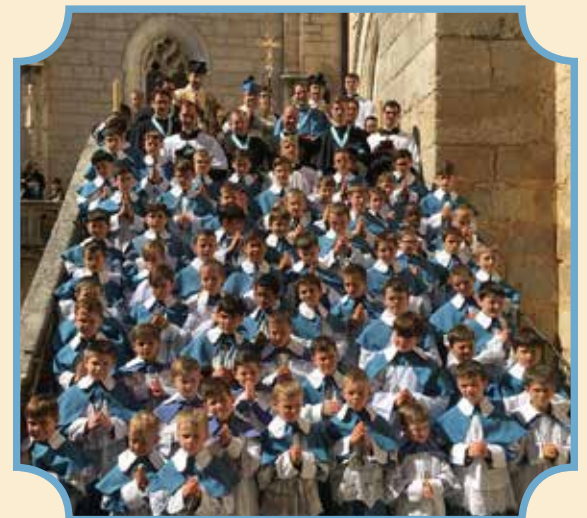
Le 30 mars à Rocamadour