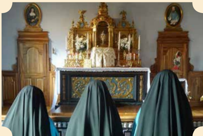
Adoration quotidienne du Saint-Sacrement