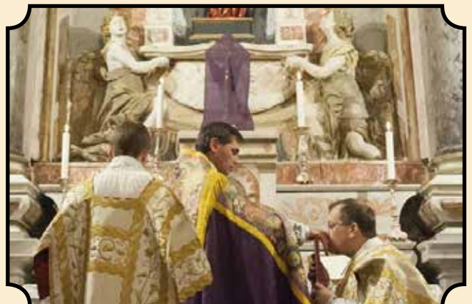
Messe solennelle au Gesù

La messe dominicale à Nice est célébrée à dix heures dans cette chapelle de pénitents si bien placée (la mer à vingt mètres et appuyée sur la colline du château).