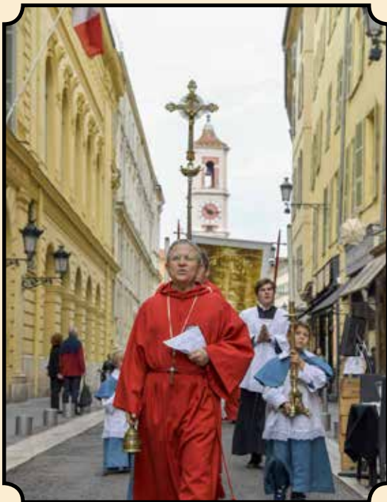
Procession dans les rues de Nice

Le prieur de la maison est aussi recteur de la confrérie du Saint-Suaire et de la Sainte-Trinité des pénitents rouges. Ces laïcs réclament le soutien de leur aumônier pour les accompagner dans leurs activités pieuses certains après-midi et soirs de la semaine : Messes en semaine, confessions, chemin de croix, adoration du Saint-Sacrement, sans parler de leurs différentes réunions et des formations chrétiennes. Cette confrérie possède une très belle chapelle sur le marché aux fleurs qui attire beaucoup de touristes comme les gens du pays. Les Niçois sont très attachés à leur patrimoine. Tous sont très édifiés en entrant dans cette chapelle d'y trouver des hommes revêtus de leur « sac » en train de prier, et tous sont ainsi rappelés au fond d'eux-mêmes à leurs devoirs de religion.